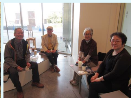
歩き疲れてコーヒープレイク