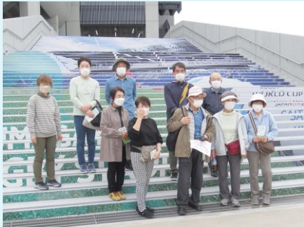
入場前の階段にて

花ボラの後に実施され、37期の参加者は、両日合せて6名。ラグビー場の施設を興味深く見学したり、公園内のウォーキングロードを楽しく歩いたりなど、各々充実した学習会となりました。10月12日の写真を載せます。