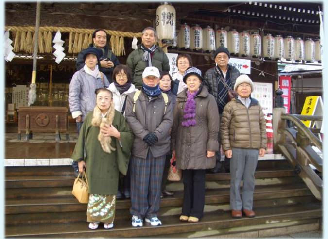
50回記念神社集合写真