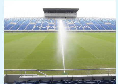
グラウンドは散水中でした