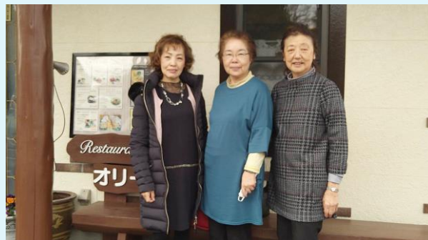
妻沼オリーブでランチ

晴れた冬の晴れ間、妻沼のオリーブでスパゲッティとピザ🍕マルゲリータのランチをしました。美味しかった。そしてコメダに移動し別腹デザート食べ話に花が ボケや痴呆や腰痛や膝痛や病院・・・頑張ろう・・・と、話に咲きました(笑) 他の日の食事会の写真も載せます。