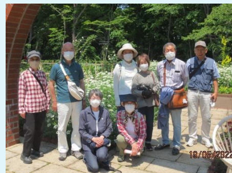
令和4年5月19日 森林公園西口にて