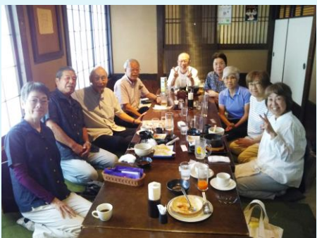
令和4年8月25日 ランチ会