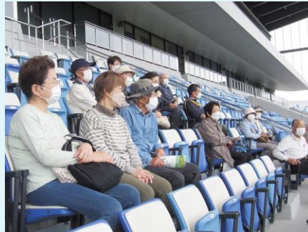
客席からグラウンドの説明を受ける