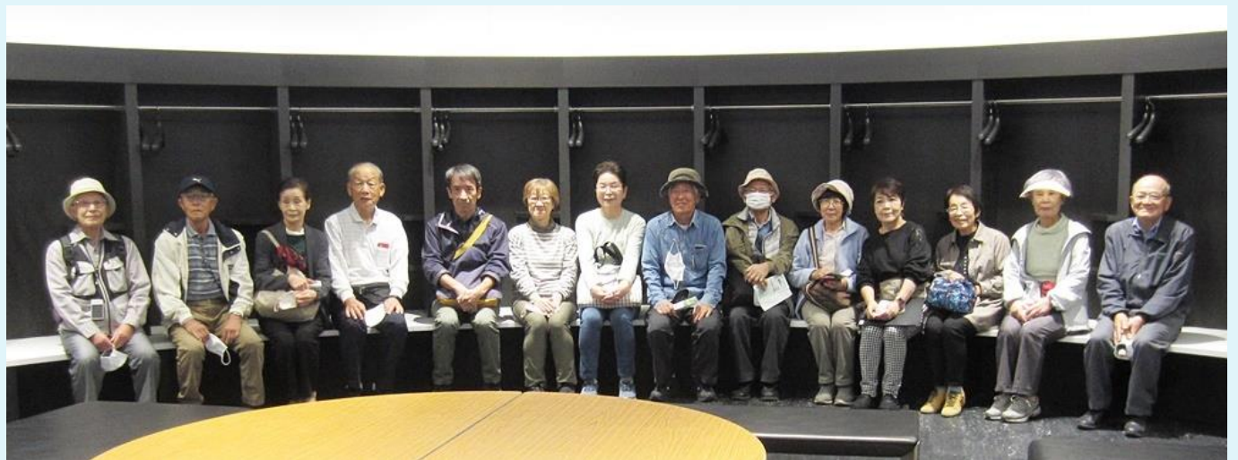
選手控室に座って