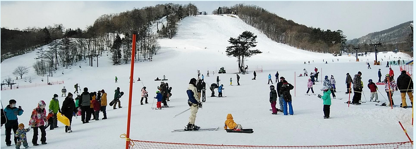
孫にひかれて5年ぶりにスキー滑ってきました。ケガなく良かったです！