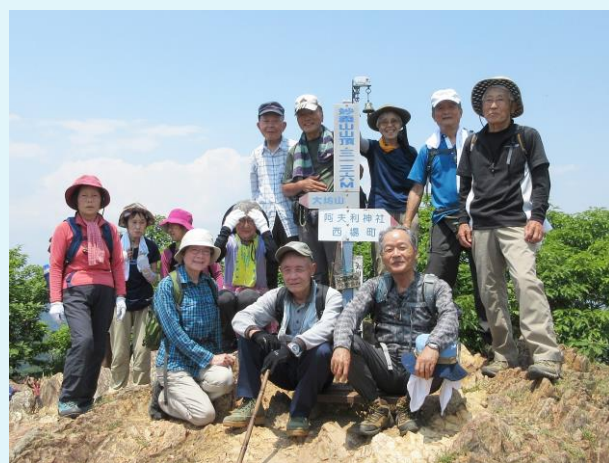
2022.06.19 足利・大小山 妙義山にて