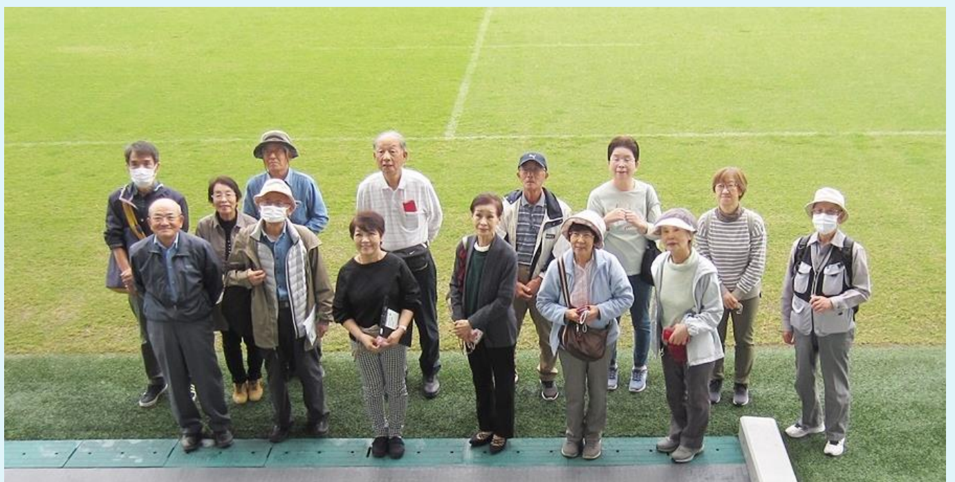
グラウンド外周に立って