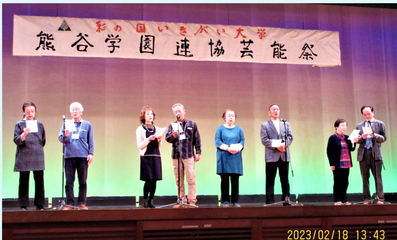
出演は1番、「懐かしの歌メロディー」を唄いました。