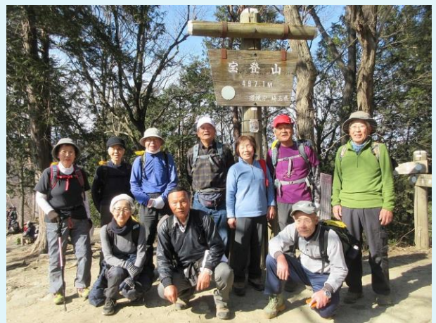
2023. 01. 22 長瀬アルプス～宝登山神社&食事