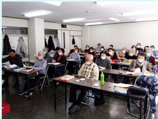
2023年2月22日 2月定例会の様様