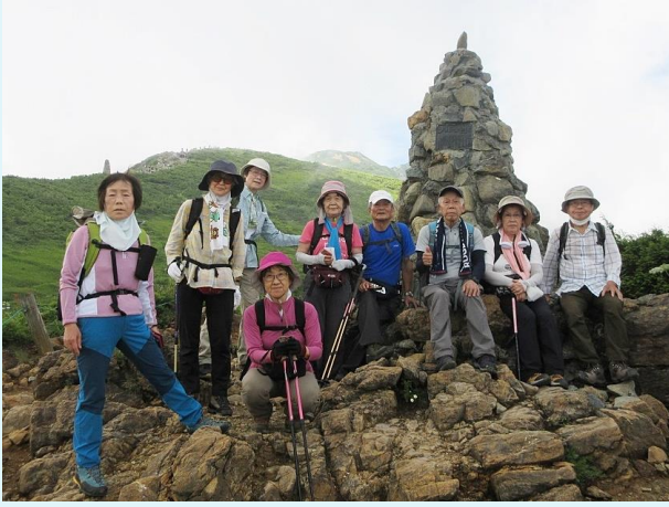
2022. 08. 02 白馬八方尾根