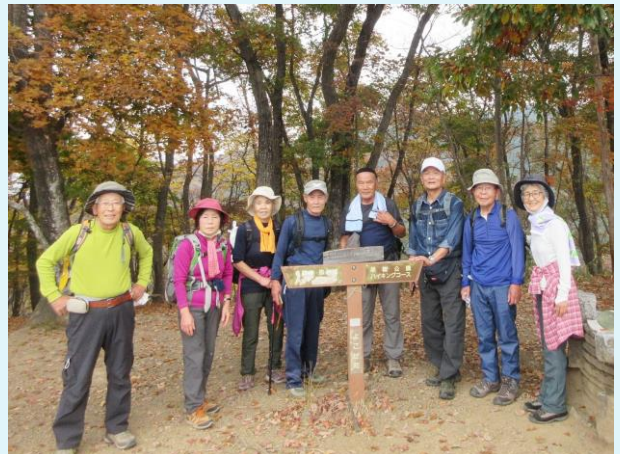
2022. 11. 13 日向山～寺坂の棚田