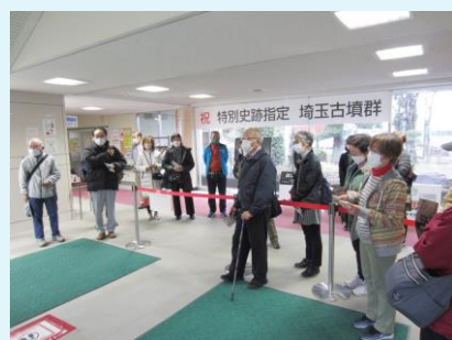
第2部の様子：「入口で説明」