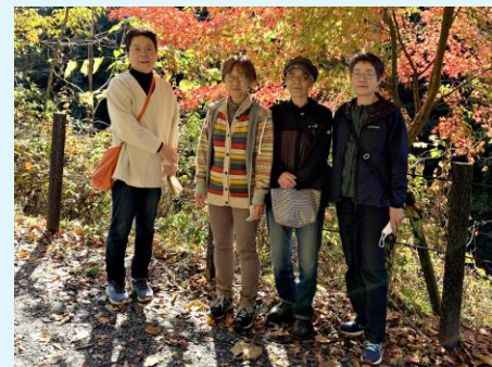
令和4年11月22日 女子会嵐山渓谷行