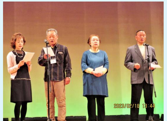
2023年2月18日 熊連協芸能祭の様様