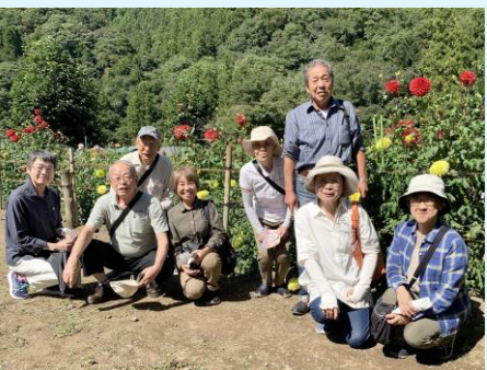
令和4年9月30日 小鹿野「ダリア園」