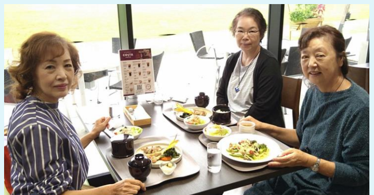
ラグビー場の隣ホテル 熊谷スポーツホテルパークウイング レコードでのランチ