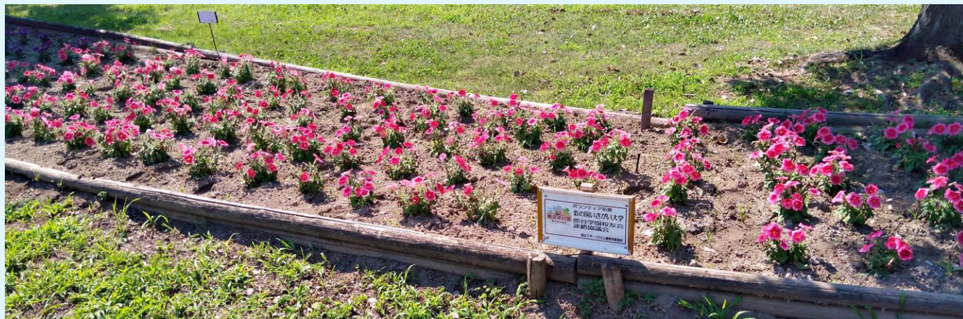
22.06.22 第3回 花壇の様

作業自体は簡単ですが、除草の姿勢によっては足腰が悲鳴(?)を上げる方もいて…。でも終了後には、皆さんと近況報告をして和気あいあいと楽しかったですね。参加の皆さんお疲れ様でした。