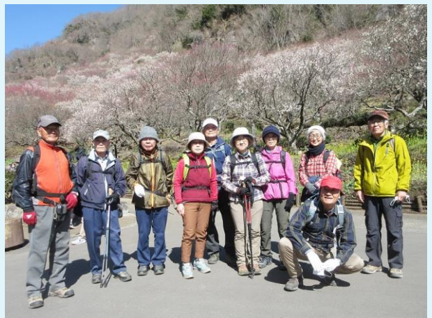
2023. 02. 26 湯河原・幕山