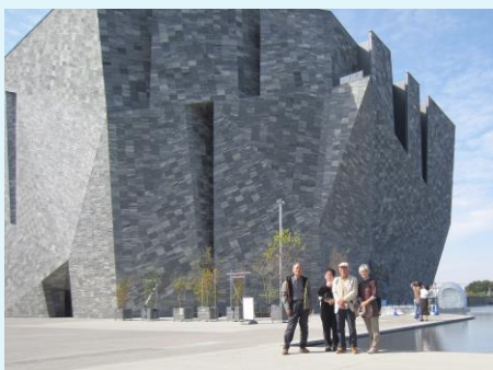
令和4年10月21日 角川武蔵野ミュージアム ゴッホを背景に