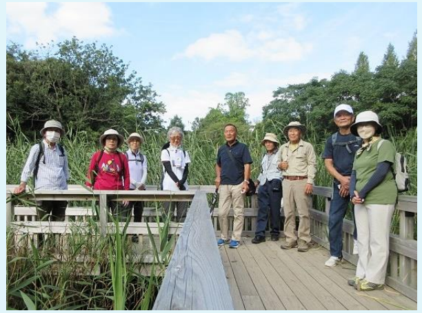
2022. 09. 11 北本市自然景観観察