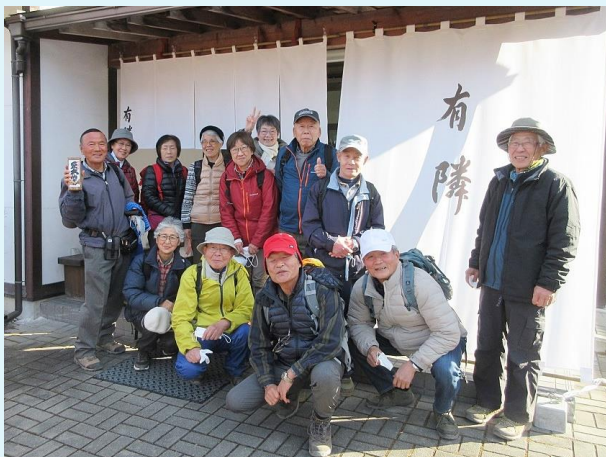
2023. 01. 22 長瀬アルプス～宝登山神社&食事