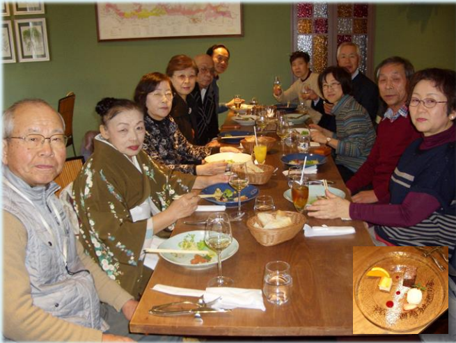
50回記念のプレート料理でした

令和5年4月から、クラブ名を「寺社めぐりクラブ」から「東京庭園めぐりクラブ」に名称を変更し再開を予定している。なぜ名称を変えるのか？との問いには、会員全員が10歳年をとり、「お寺参り」ではなにか寂しく思いましたのでと回答したい。