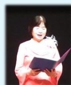
おひさまコーラス