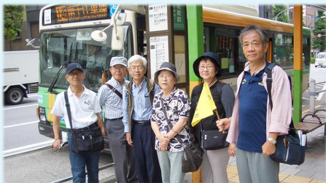
6月 下町バスでゆるり旅