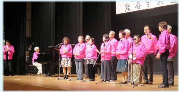
歌声喫茶いきいきクラブ