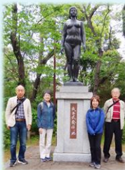
蕨市 成人式発祥の碑