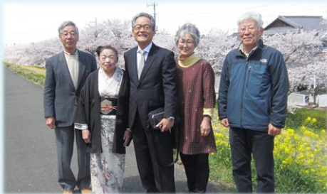
総会后お花見 とお茶会