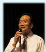
芸能祭実行委員長