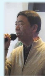
11月 忘年会でのカラオケ披露の一コマ