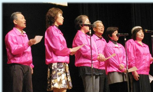
2月 熊連協芸能祭での37期会員と共に出演