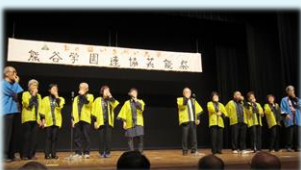
ノースフルトクラブ