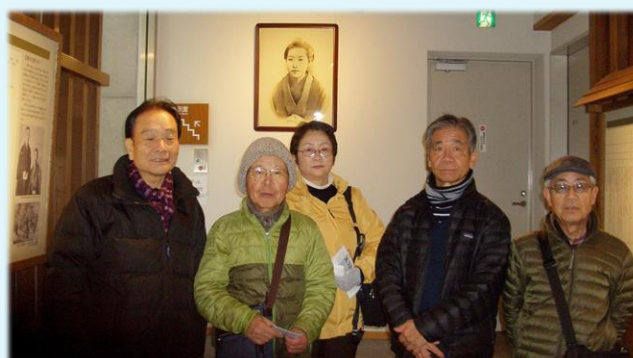
1月 樋口一葉記念館