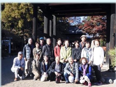
11月 深谷宿街歩きと 写経体験