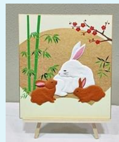
萩原 静枝さん：手工芸 (パッチワーク「うさぎ」)