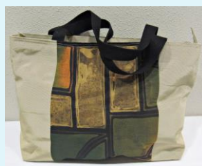
錦織 貴美子さん：手芸 (帯地バック)