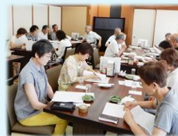
8月 定例会議と暑気払い