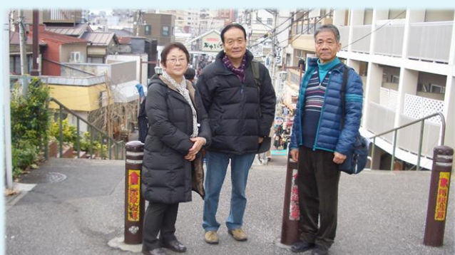
12月 夕焼けだんだん