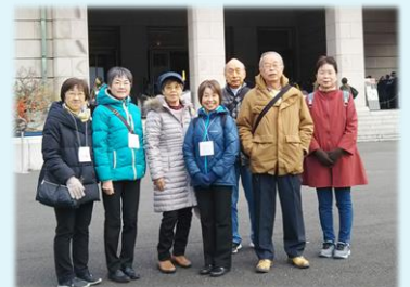
高御座&御帳台見学