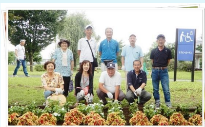
花壇ボランティア 7/24