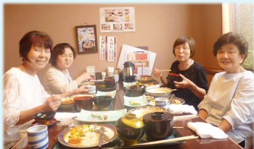
昔の仲間と一緒に昼の食事会

それ以外に歩こう会にも参加していますので、情報交換をしながら歩きを楽しんでいます。これからお互い無理をしないで、いつまでも親睦を深めて行きたいと思います。