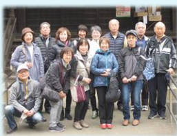
2月 鴻巣ひな祭りと歴史散歩