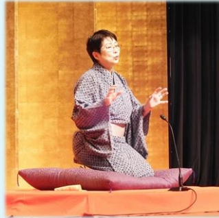
花追亭みみ寿師匠