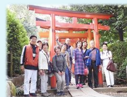
10月 『谷根千エリア』を お散歩して来ました