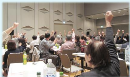
10月 「うたごえ秋のスペシャルコンサート」