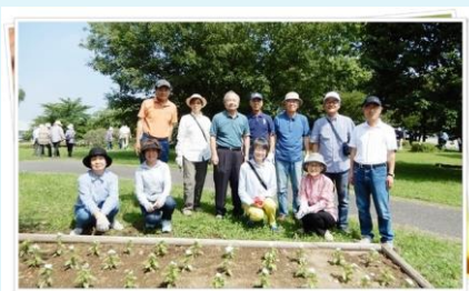
花壇ボランティア 6/26

農林公園夏祭りは8月3日～4日に開催されました。従来は最新校友会が担当しましたが、43期は会員が少ない為、37期も応援参加しました。