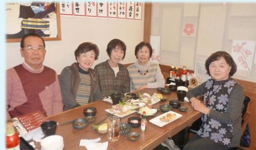
これから忘年会です