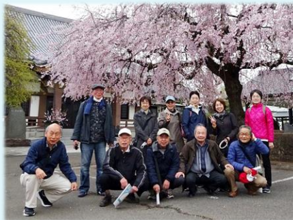
(諏訪神社のお隣の浄源寺さんで)