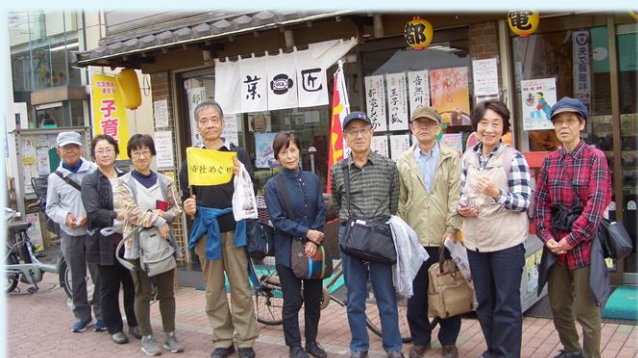
10月 都電で途中下車の旅