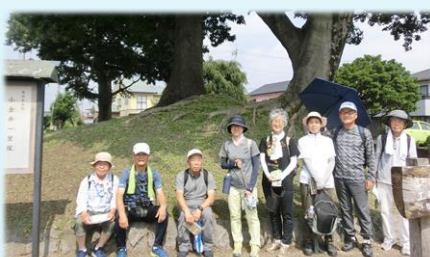
8月 小金井の一里塚