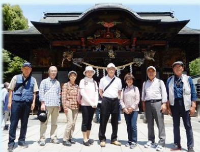
5月 秩父へ行ってきました