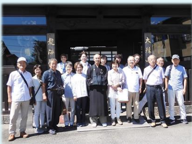
9月 歴史探訪（群馬県庁周辺）