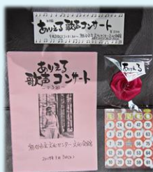
9月 “ありえるバンド”「歌声コンサート」