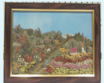
荻原 芙美子さん：ガラスアート (山の風景)