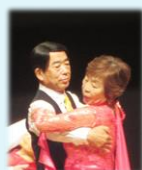
チェリーダンスクラブ