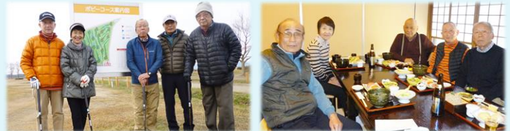
パークゴルフと食事会