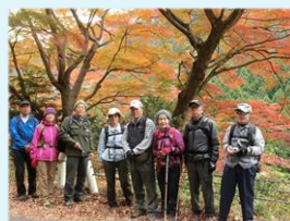
奥多摩・いろは楓前