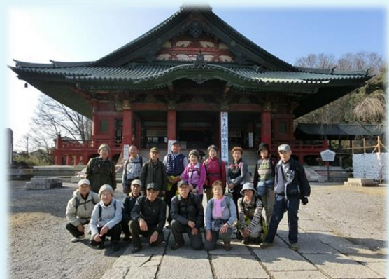
太田七福神めぐり・呑龍様