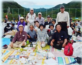
吉田町龍勢・棕神社