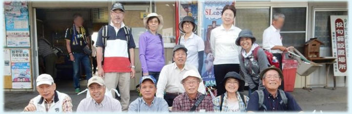
いざ、龍勢へ 皆野駅前

秋は大宮氷川神社・鉄道博物館、吉田町農民ロケット龍勢、都電荒川線の旅とバラエティーに富んだ史跡めぐりでした。意外と初めて行く史跡が多く興味津々であった。本年の最後は歴史について勉強会を開催予定で、まだまだ知らない名所旧跡等を発掘して、