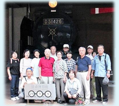
大宮鉄道博物館 D51前