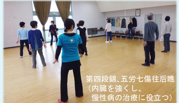
第四段錦、五勞七傷往后瞧 (内臓を強くし、 慢性病の治療に役立つ)

11月11日（土）森林公園・運動広場にて600名余りの方々と太極拳を楽しみました。