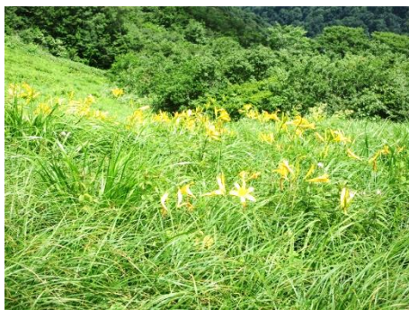
(ニッコウキスゲ群生)