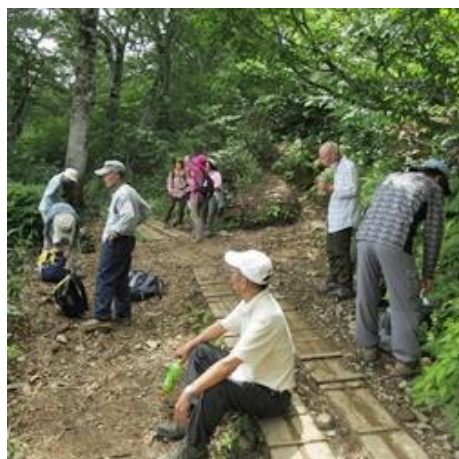
(天神峠への分岐で休憩)