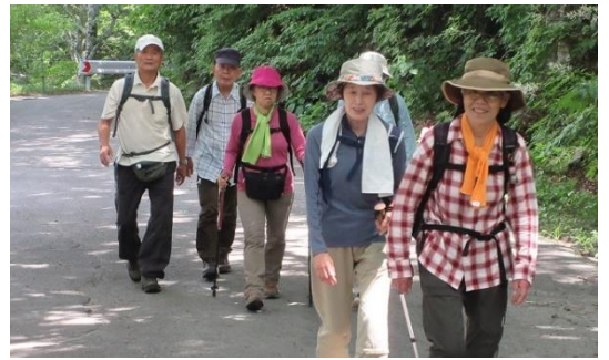
(マチガ沢出合へ旧道を歩く)