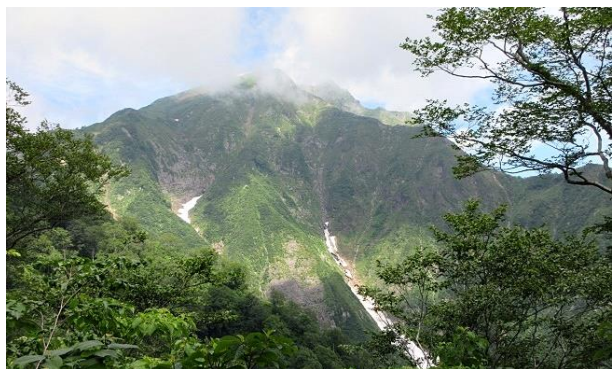
(途中、谷川岳を眺める)