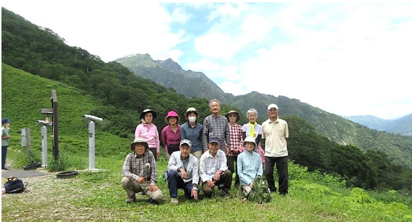
(谷川岳をバックに)

天神平で 30 分の昼食を楽しみロープウェイで下山。当初、一の倉沢出合までの往復を予定しておりましたが、バス時刻の関係からマチガ沢出合まで旧道を往復に変更しました。マチガ沢付近にクマの出没情報が出されており注意するようにとの指示もありました。13:30 マチガ沢に到着、下から見上げる谷川岳の勇壮な山容に今なお憧れる山男・山ガールの願望を感じる一コマでした。14:20 バス停到着、15:10 発の水上行きバスで帰路に。