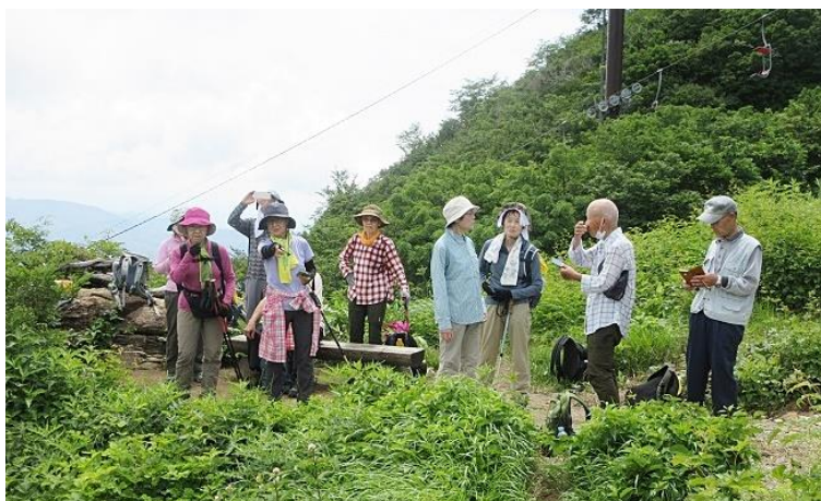
(天神峠手前での休憩)