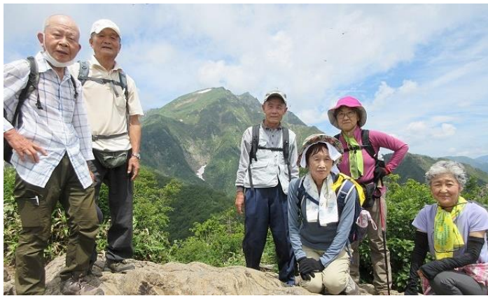
(谷川岳をバックに1)