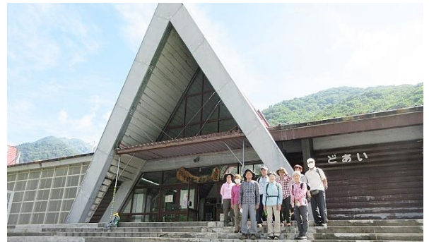
(「もぐらトンネル」登り始め) (トンネル内、中間地点で)