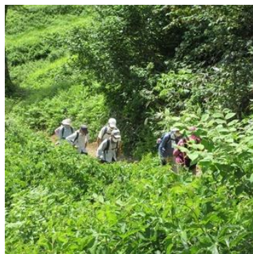
(登山道を登り始め)

谷川岳への登山道から登り始め、天神峠への分岐から峠を目指しました。途中厳しい登りもわずかの区間で尾根に出ました。見晴らしの良い尾根歩きではニッコウキスゲの群生や素晴らしい風光を堪能しつつ天神峠に到着です(11:10)。谷川岳をはじめ笠ヶ岳・至仏山・武尊山と周囲の山並みも見ることができました。