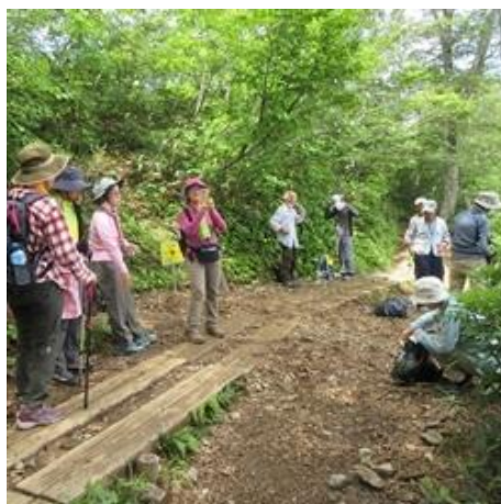
(休憩中のスナック)