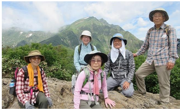
(谷川岳をバックに2)