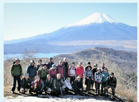
2014年 第27回 石割山