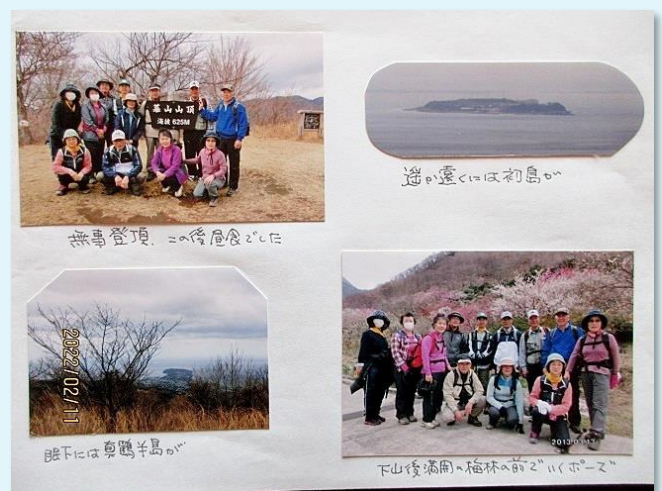
2013年 第7回 卒業記念・幕山