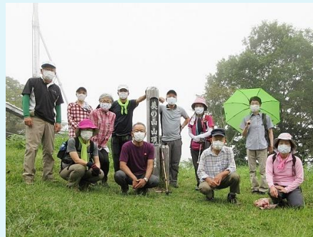
2020年 第89回 コロナ禍の箕山