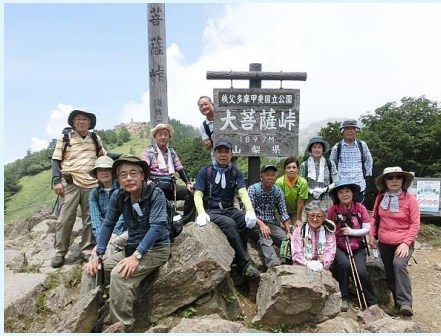
2018年 第69回 大菩薩峠