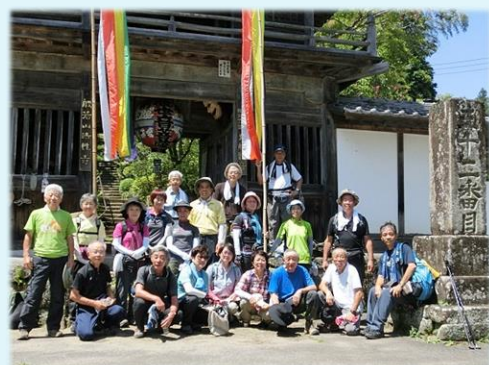
2014年 第7回 秩父札所巡り・32番札所