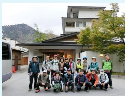
2016年 第49回 奥日光一泊ハイク ・湯本温泉