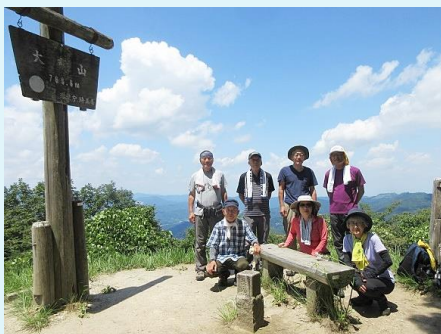
2021年 第96年 大霧山