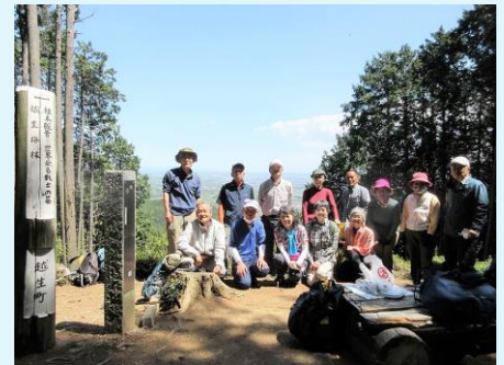
2021年 第94回 大高取山