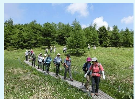
2017年 第58回 池の平湿原