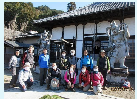
2022年 第101回 越生七福神めぐり