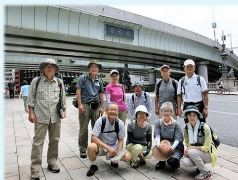
2018年 第1回 7月 日光街道歩き・日本橋