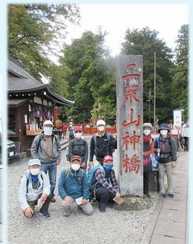
2020年 第18回 10月 日光街道歩き・二荒山神橋