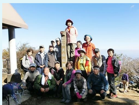
2015年 第38回 伊勢原・大山