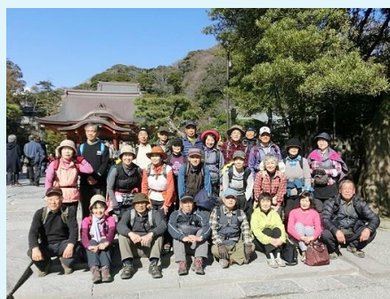
2014年 第18回 鎌倉アルプス