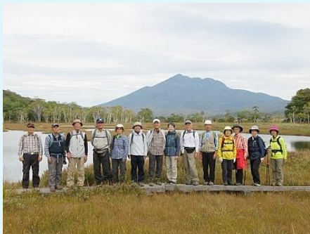
2019年 第83年 秋の尾瀬