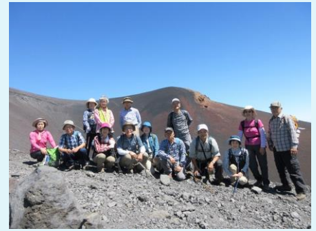
2019年 第82回 富士山・宝永火口縁