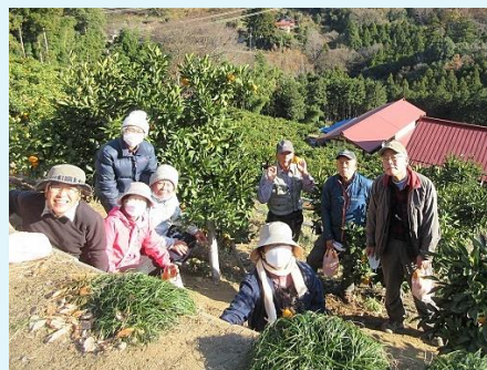
2021年 第100回 金ヶ嶽～風布みかん山