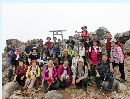
2013年 第13回 那須・茶臼岳