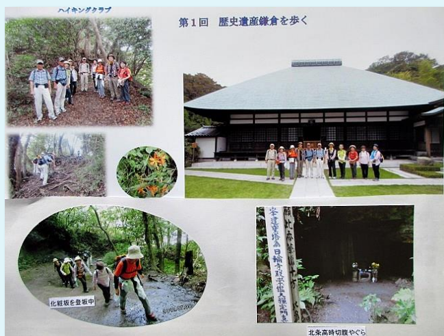
2012年 第1回 鎌倉・祇園山コース

私たちは「自然と親しみ、健康の維持と会員相互の親睦を」を目的に取り組み、多くの思い出と成果を得る事ができました。これからも年齢的衰えを克服し、体力に見合う活動を継続する気持ちで頑張りましょう。