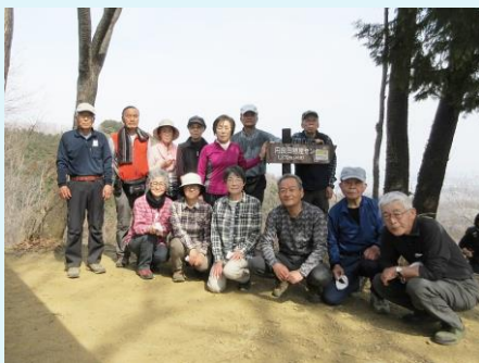
2022年 第102回 3月13日 鐘撞堂山（虎ヶ岡城址コース）