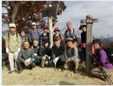
2018年 第73回 官ノ倉山