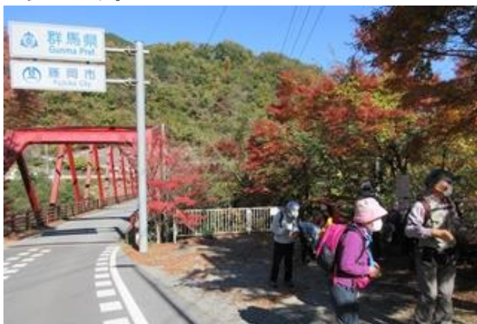
(バス停登仙橋下車)

今回は、本庄駅からバスを乗り継ぎ、三波石で有名な三波石峡を歩くため登仙橋バス停で下車をして11時スタートです。途中川底をみるために下る道も数本ありましたが川沿いをダム湖手前まで歩きます。