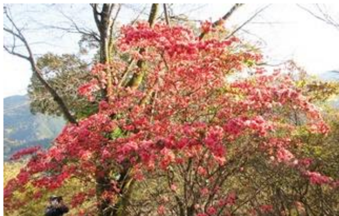
(ツツジが満開でした)