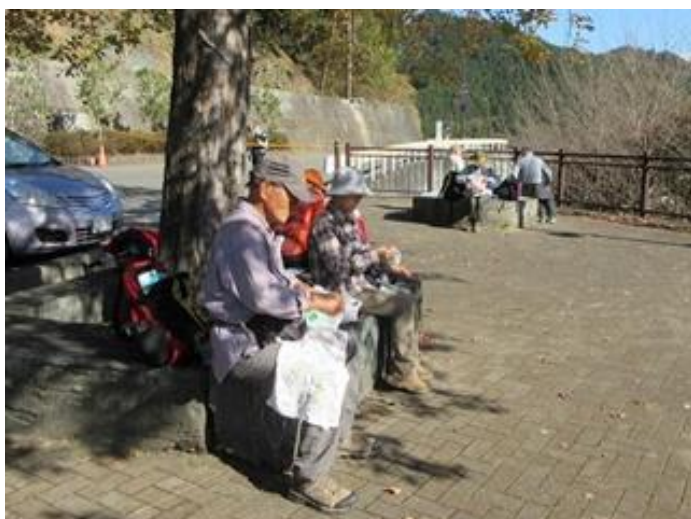
(ダムサイトに規制線)

ここから埼玉県側への「ダム堰堤の通行は現在できない」との説明と、解除見込みも不明とのことでした。ひとまず昼食を摂り待機です。