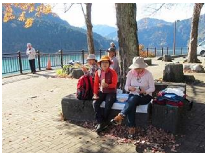
(ダムサイトで昼食)