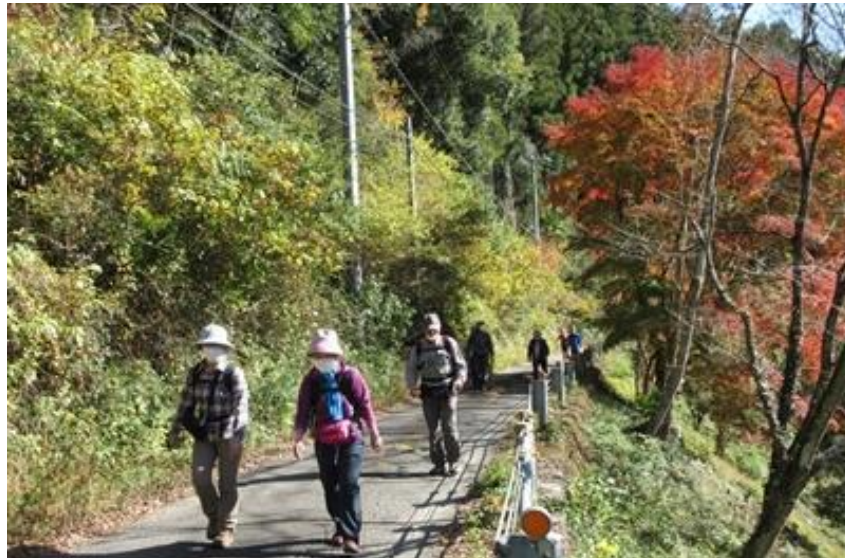
(三波石峡沿いを歩く)