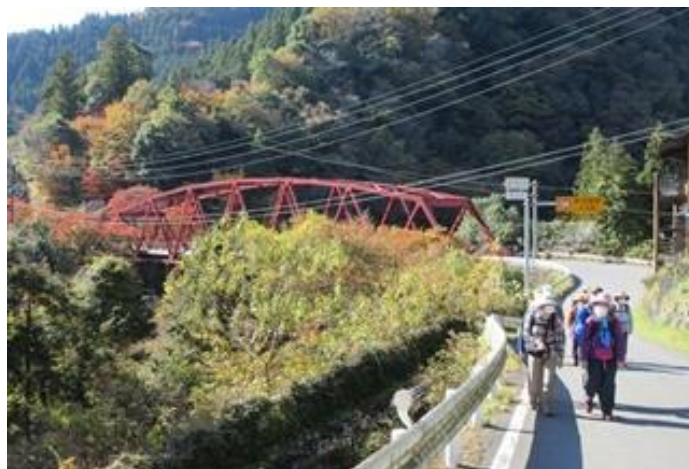
(登仙橋からスタート)