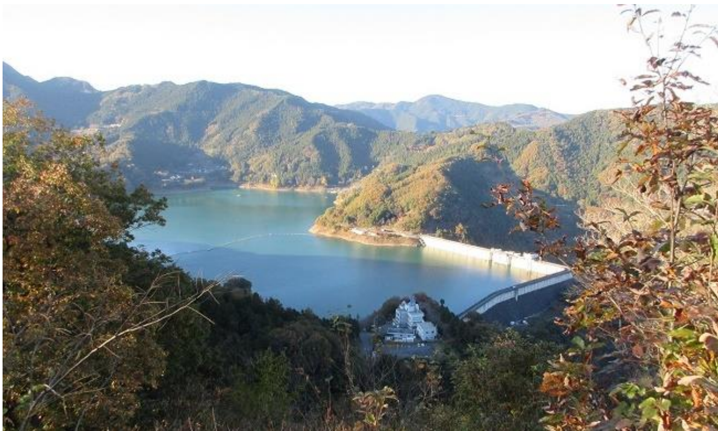
(園内展望台からダムを望む)