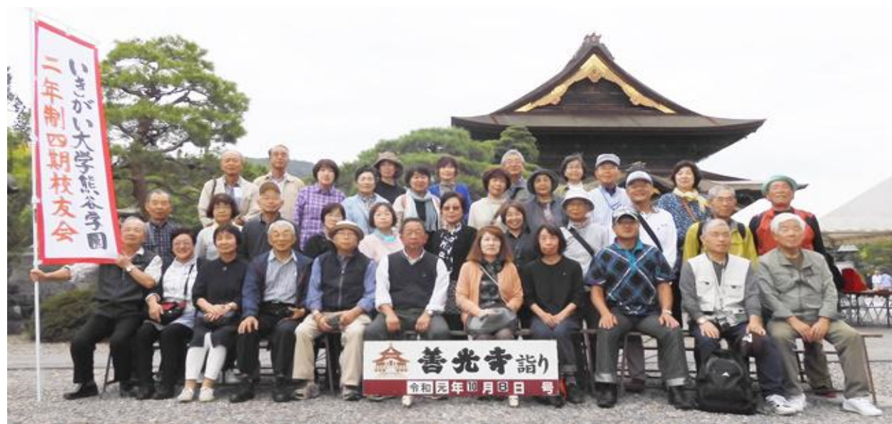
善光寺での記念写真

観光客が多い中で一際目立つのが、「2-4期校友会」のぼり旗です。迷子にならない。