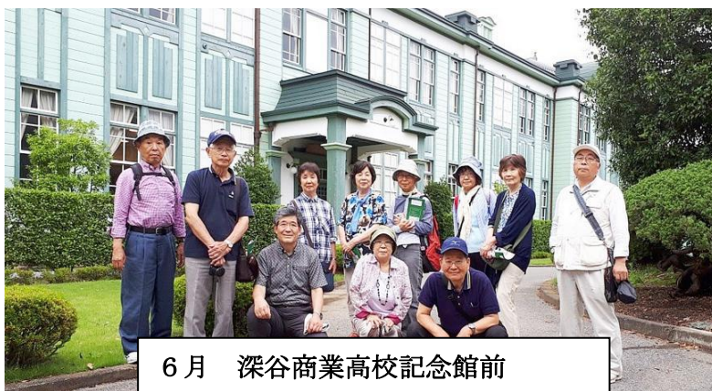
6月 深谷商業高校記念館前