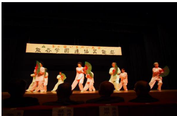
太極拳クラブ(太極拳扇)