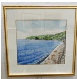
中村尊次 水彩画 (網代の海)