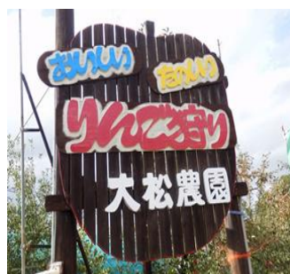
リンゴ狩り (リンゴ買い)