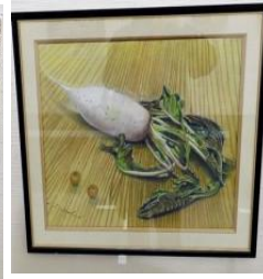
伊藤清治 水彩画 (静物画)