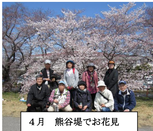
4月 熊谷堤でお花見