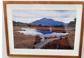
(尾瀬逆さ燧ヶ岳)