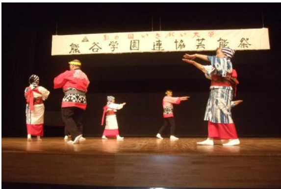
民踊クラブ(正調串本節)