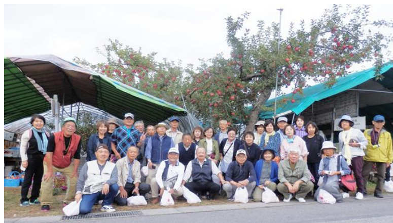
リンゴを買って記念写真