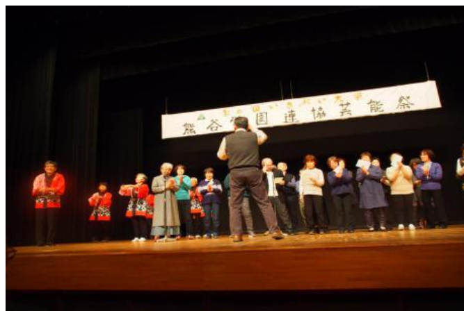
2-4期校友会全員(新東京オリンピック音頭)