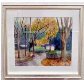
船戸あけみ 水彩画 (小雨の忍城)