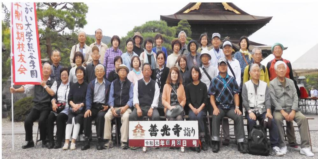
令和元年10月8日 懇親旅行（善光寺・小布施）