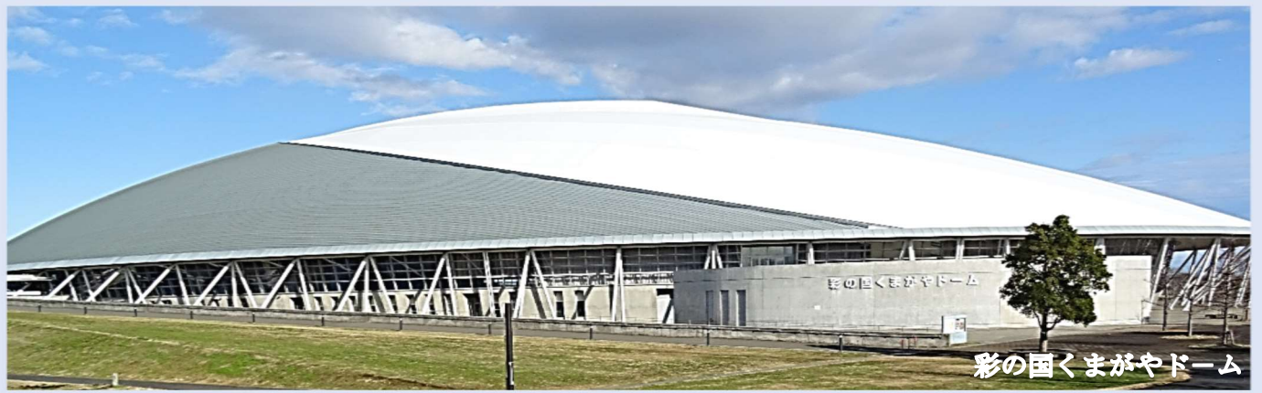
彩の国くまがやドーム