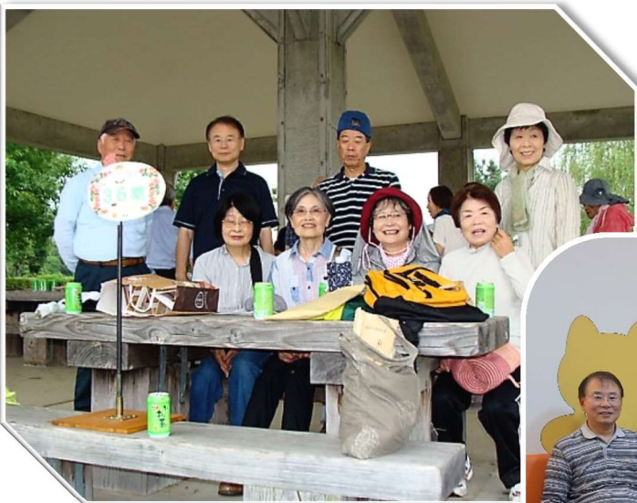
7/14 ; 花ボラ・6,7班担当

女性の方達は結構そろって出かけているようですが、次年度は班活動も活発にしていき絆を強めていきたいと思います。