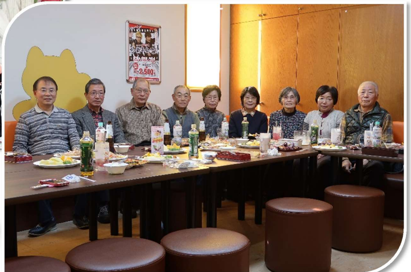
12/5 ; 忘年会