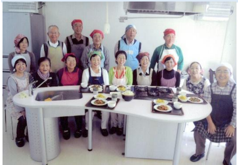
完成料理を前に、先生を囲んでパ刊