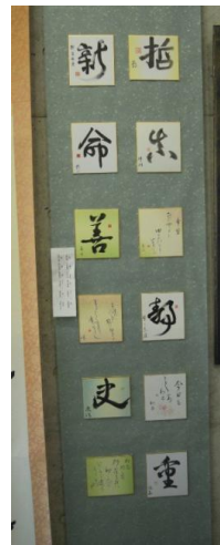
文化祭・漢字一文字