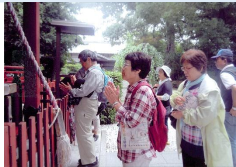
金鑽神社にて (真摯にお祈り・・・)