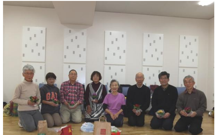
民踊クラブのオールメンバーです