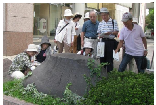
9月 まさに大発見、八木橋前宮沢賢治熊谷逗留記念歌碑