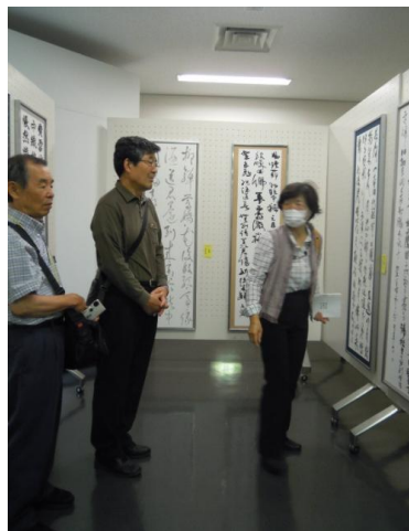
県展で観賞法を学ぶ