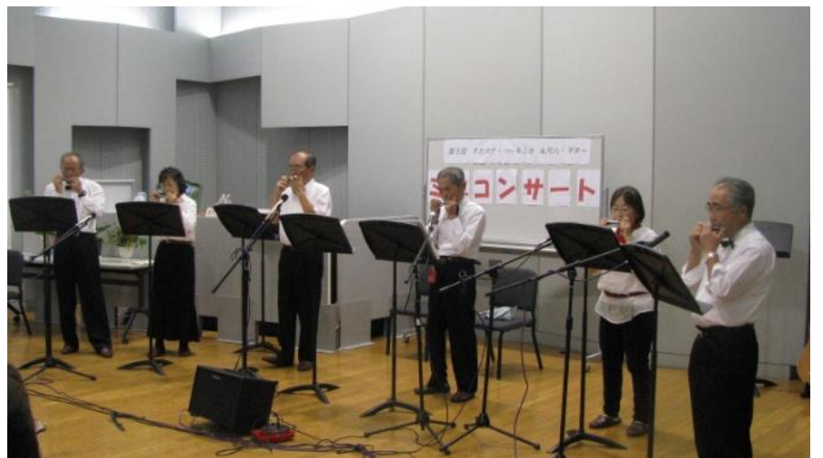
9月 熊谷「さくらめいと」でミニコンサート