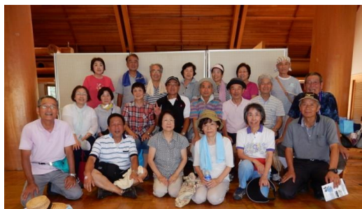
暑い中お疲れさまでした