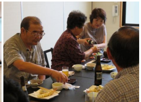
チョットお酒落して、ランチしました