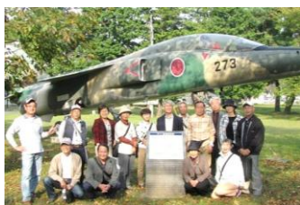
F1支援戦闘機の前で