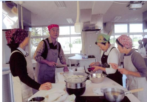
グループ毎に分かれて、さあ頑張るぞ!