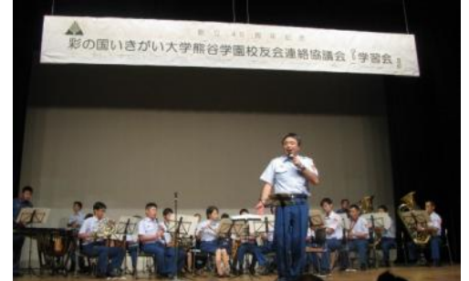
熊谷消防音楽隊の演奏