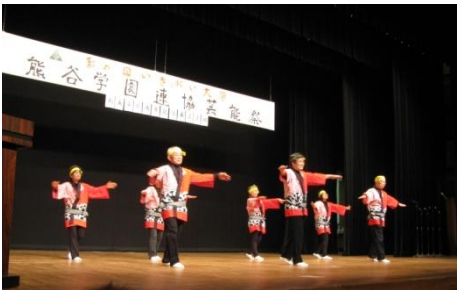
千葉県民踊・東浪見甚句