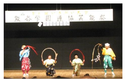
2-3期生の南京玉すだれ