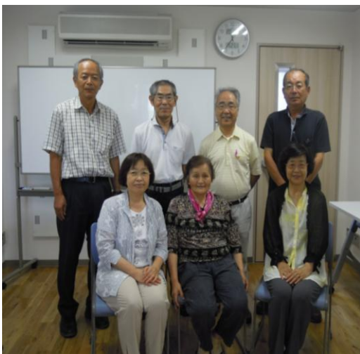
練習後のフルメンバーです

私たちハーモニカクラブはメンバーの変更はありましたが、卒業後も継続して、男女計7名が毎月2回、熊谷の「くまびあ」で練習しています。9月には「さくらめいと」でオカリナグループとミニコンサートをを行いました。10月には毛筆クラブと合同で一泊の研修旅行に行き、バスの中や宴会でも演奏し、盛り上がりました。12月には鴻巣「花久の里」で発表会を行い、オカリナ2グループと我々ハーモニカ3グループ(4期生、5期生、1年制1期生)が演奏しました。そして、1月には初めてのボランティア訪問にもチャレンジしました。高齢の入居者から大変喜んでいただきましたが、気が付くと我々自身が一番楽しんでいました。玩具みたいな小さな楽器ですがこれからもネットワークを広げ、仲間を増やして活動していきたいと思います。 野口 (記)