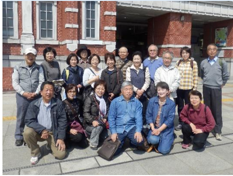
深谷駅全員集合の面々