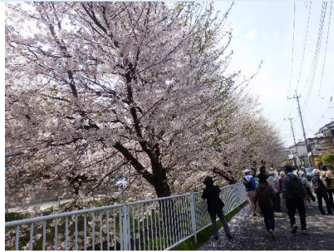
唐沢川沿い桜並木散策