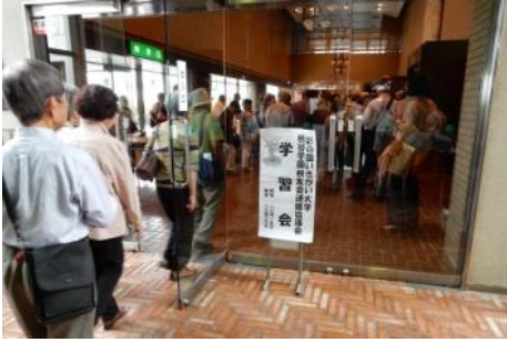
学習会会場の受付