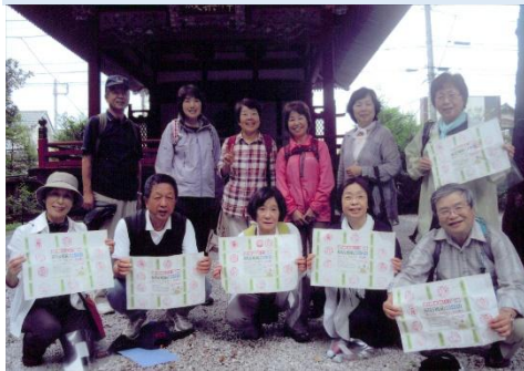
6km完歩、記念スタンプラリーゲット